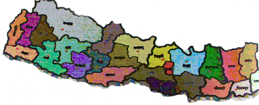
चित्र नं. १

डा. हर्क गुरुङ्गले नेपालमा विकेन्द्रीकरणको सम्बन्धमा लेख्नु भएको एउटा शोध-प्रबन्धमा* देशको वर्तमान प्रशासनिक विभाजनहरू उपयुक्त नरहेको ठहर गर्दै देशलाई २५ जिल्लाहरूमा विभाजित गरेर ती जिल्लाहरूमा विकेन्द्रीकरणको नीति अन्तर्गत बढी अधिकार प्रदान गर्ने सिफारिस गर्नु भएको छ। संघीय शासनको मागको वर्तमान परिपेक्ष्यमा त्यस शोध प्रबन्धको अब त्यति सान्दर्भिकता नदेखिए पनि त्यस विभाजनको प्रस्तावबाट डा. गुरुङ्ग मधेस र मधेसीप्रति पूर्वाग्रही तथा मधेसको भाषा, संस्कृति र मधेसीको राजनैतिक, सामाजिक तथा आर्थिक विषयहरूमा आम सहभागिताको विरोधी रहेको स्पष्ट हुन्छ। काठमाण्डौं उपत्यकालाई वहाँले एकीकृत गर्ने धारणा राख्नु भएको छ।