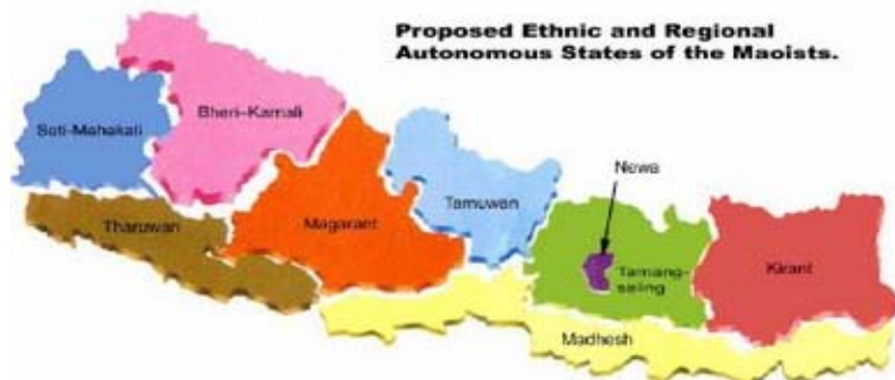
चित्र नं. ३

बढी प्रदेशको संख्याले देशको स्थायी खर्च बढाउने हुँदा ९ वटा प्रदेशमा देशको विभाजन नगरी सांस्कृतिक र विकासको सन्तुलन कायम गर्न ४/५ वटा प्रदेश र सो अन्तर्गत स्वशासित प्रखण्डहरूको व्यवस्था उपयुक्त हुने देखिन्छ ।